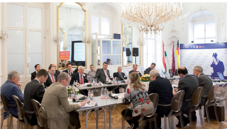
Expertengespräch Perspektiven der Erinnerungskultur am 25. April 2013 an der AUB

Neben der Förderung eines werteorientierten europäischen Bewusstseins und der aktiven Teilhabe der Zivilgesellschaft an demokratischen Prozessen verfolgt die Konrad-Adenauer-Stiftung auch das Ziel, eine verantwortete Erinnerungskultur aufzubauen. Darüber hinaus stehen Fragen der Außen- und Sicherheitspolitik, Nachhaltigkeit sowie die Soziale Marktwirtschaft im Mittelpunkt der Projektarbeit.