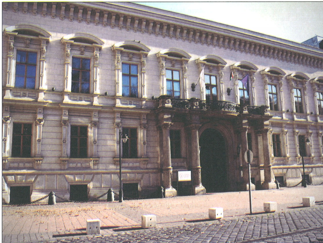
Az Andrassy Egyetem épülete

Jelentkezési határidő: 2014. november 15-e. Az esetleges, nyári pót-felvételi eljárásra vonatkozó határidővel kapcsolatban kérjük, kísérje figyelemmel az erre vonatkozó tájékoztatást a www.felvi.hu honlapon. További információért látogassa meg honlapunkat: www.andrassyuni.eu , vagy forduljon hozzánk közvetlenül az LLM@andrassyuni.hu címen.